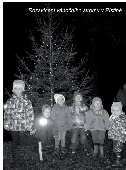
Rozsvícení vánočního stromu v Pístitně

Vážení spoluobčané, ráda bych Vás a Vaše příbuzné jménem