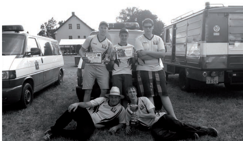
Mladí hasiči v Mirochově, 4. místo v soutěži v požárním útoku