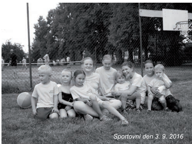
Sportovní den 3. 9. 2016