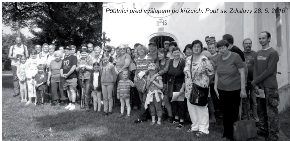
Poutníci před výslapem po křížcích. Pout' sv. Zdislavy 28. 5. 2016