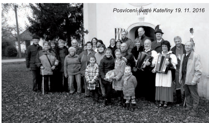
Posvícení svaté Kateřiny 19. 11. 2016