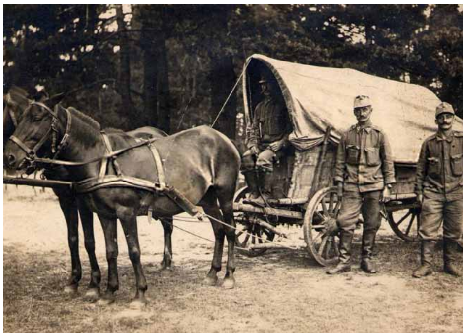
Košský povoz s vojáky Infanterieregimentu Nr. 75 ( Jindřichův Hradec ), 1. Feldkompagnie