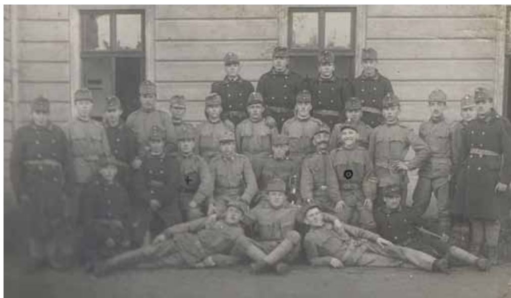
75-1-p.pl Debreczen Uhry 1916