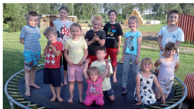
Pístinští děti na oslavě červen 2020

Pístinský zpravodaj • Vydavatel: Tělovýchovný spolek Pístina z. s. • Redaktor: Marcela Adamová (-ma-)