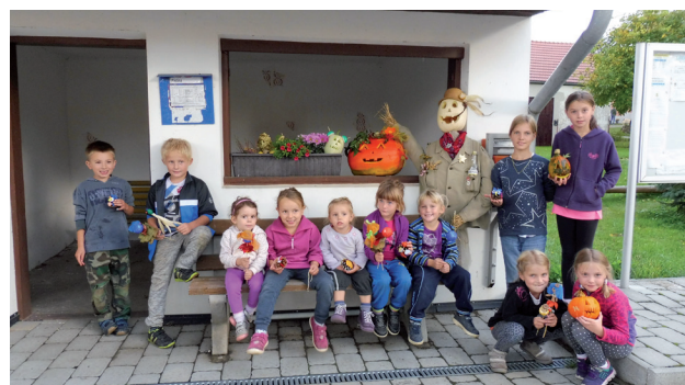
Dýňové tvoření 28. 9. 2019