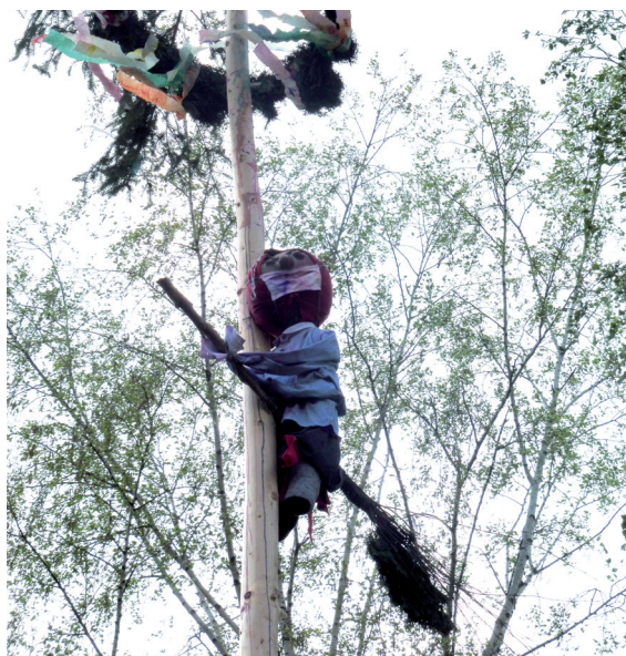
I čarodějnice měla letos svoji roušku...