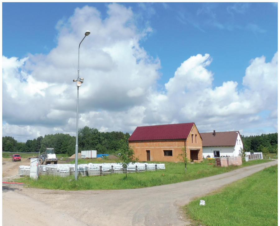
Nová Pístina - vznikající výstavba v ZTV Sever