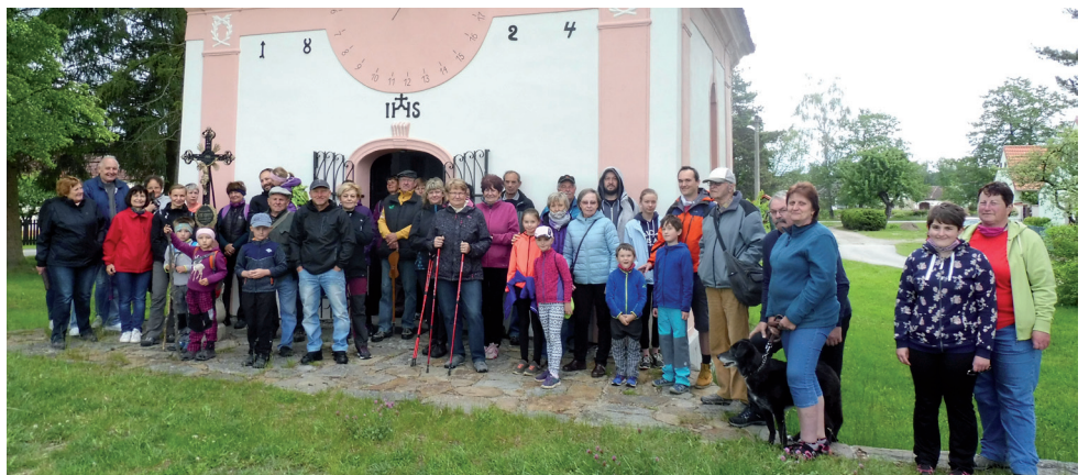
Pouť svaté Zdislavy 30. 5. 2020