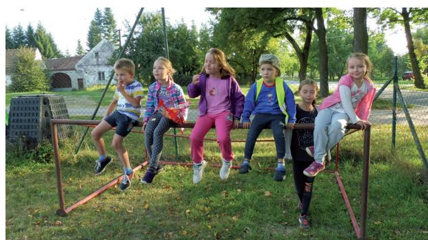
Sportovní odpoledne v Pístině 14. 9. 2019

Vstupné dobrovolné, občerstvení zajištěno